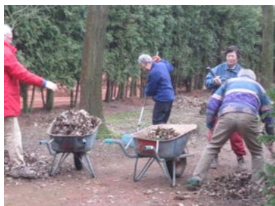
enkele deelnemers in 2012

Organisatie nogmaals bedankt voor de fantastische avond en de heerlijke hapjes..